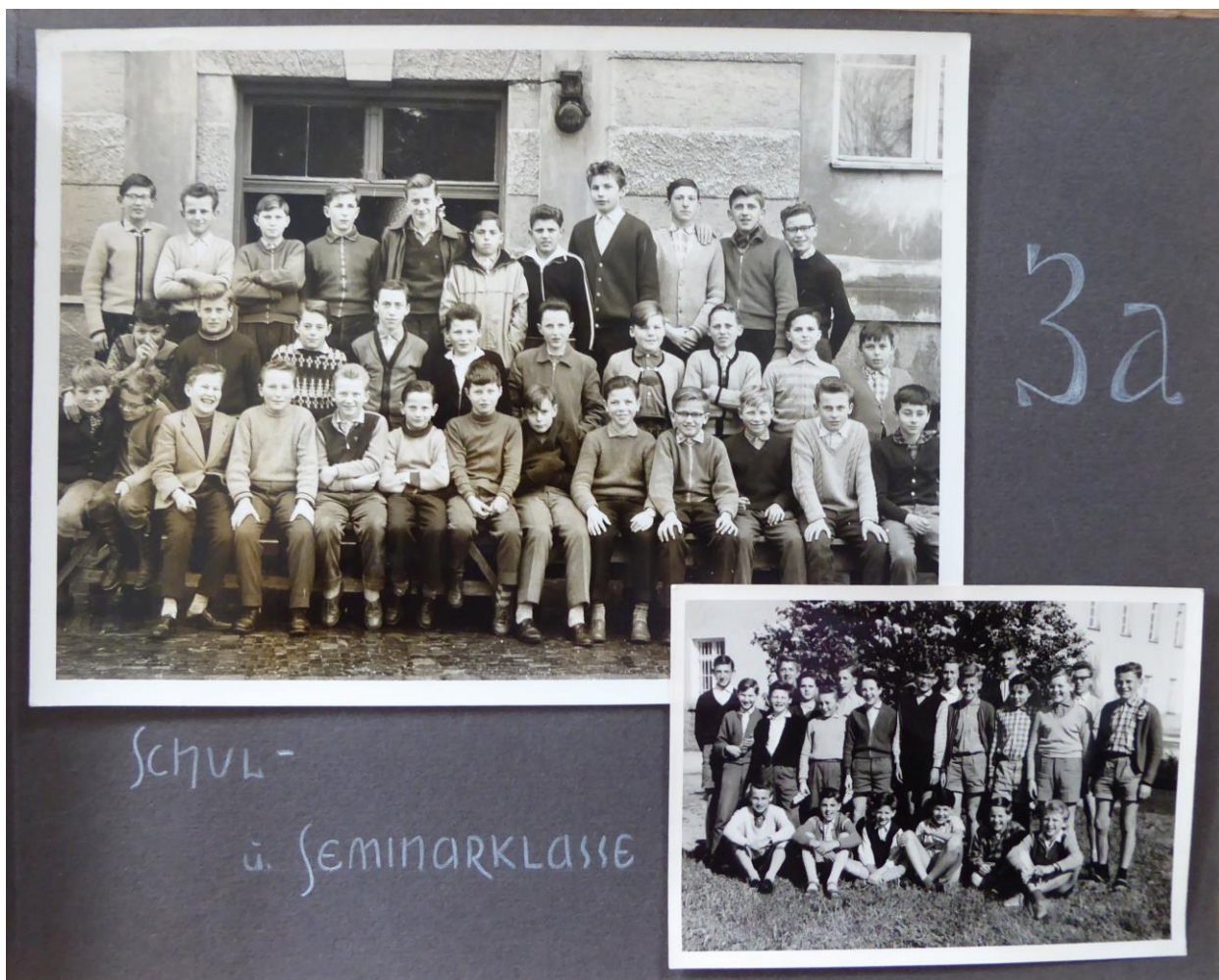
SCHUL- u. SEMINARKLASSE