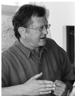
Fotos: Kindheit als Wirtsbub im Hofbräukeller Rosenheim Blick vom Wirtshausgarten in die Alpen Kgl. Bayerischer Hofkutscher auf Schloss Herrenchiemsee Arbeit in Edinburgh, der Hauptstadt Schottlands Allgäu: Der Hobby-Landwirt kutschiert „internationale Gäste“ Professor an der Universität Montevideo / Südamerika In Indien am Taj Mahal, Jahrtausendbau der Liebe Dozent in der Erwachsenenbildung, z.B. in Irsee und Kempten